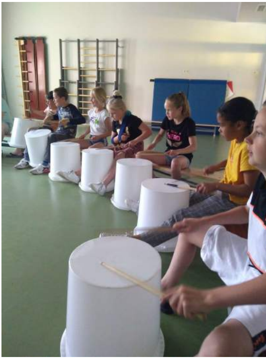
Groep 6/7 E Waste race