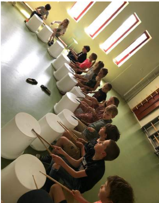
Groep 5 in uitvoeringsopstelling en groep 6:

Was het vroeger nog : Twee emmertjes water halen, twee emmertjes pompen. De tijd dat iedereen nog rondsjuwde met klompen of een houten been? Nu is het Beat the Bucket. En dat dat veel plezier oplevert kun je onmiddellijk van de foto's aflepen. Gisteren, maandag 7 juni was er in groep 5 en in 6 een gastles trommelen.